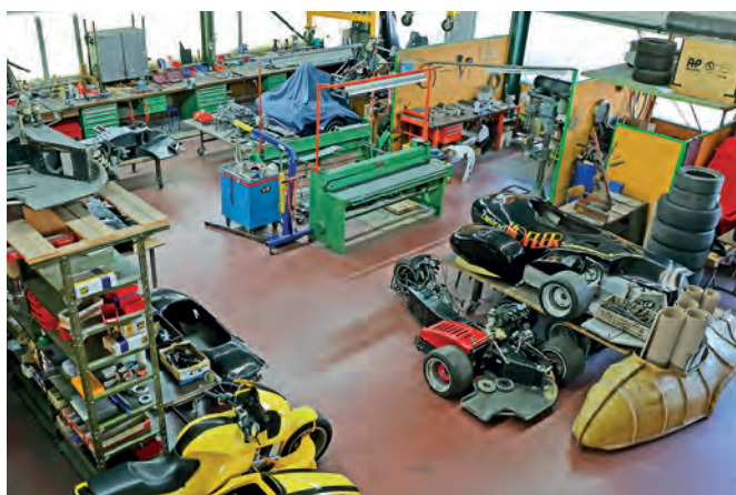
66 | Weltmeistermacher Zum Interview