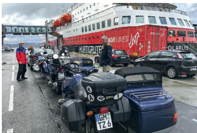
52 | Jetzt aber hurtig Über den Polarkreis hinaus und wieder retour