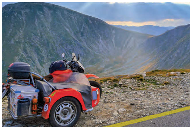
52 | Unbekanntes Bulgarien Fahrt durch Osteuropa

64 Tag für Tag Wer fährt denn noch mit einem Gespann Tag für Tag zur Arbeit? Die Antwort auf diese Frage geben stellvertretend drei unserer Leser.