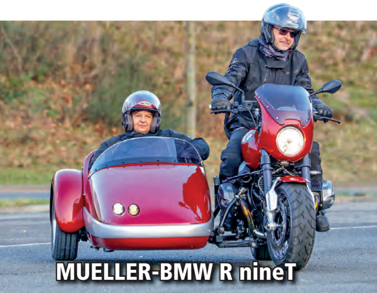
MUELLER-BMW R nineT