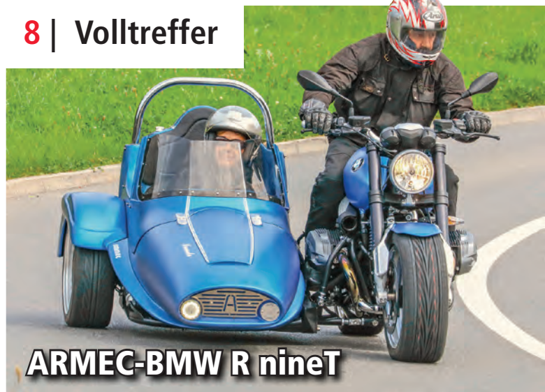
ARMEC-BMW R nineT