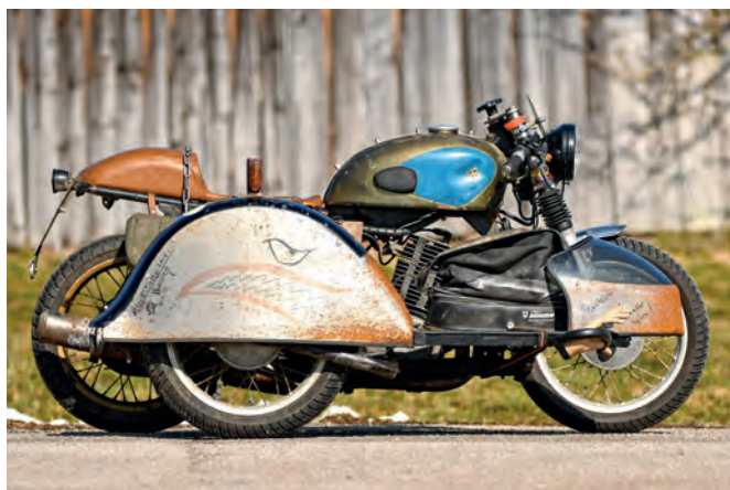
70 | Kein Gespann ist perfekt MZ Eigenbau